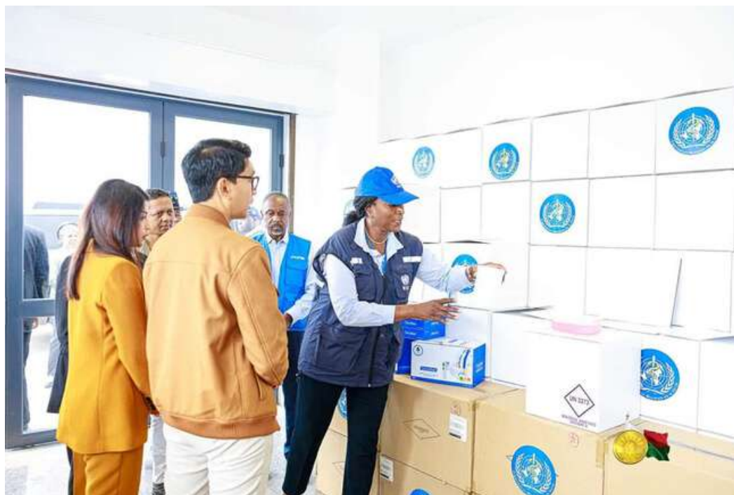
Arrivée des premiers médicaments : appui de l'OMS au Ministère de la Santé - Suivi des cas contacts

Soyons unis et solidaires contre le COVID-19. Tel est mon message dans le cadre de la lutte que nous menons tous de front actuellement. L'OMS continuera, à l'instar du SNU et de tous les autres partenaires, à soutenir le Gouvernement malgasy dans ses efforts.