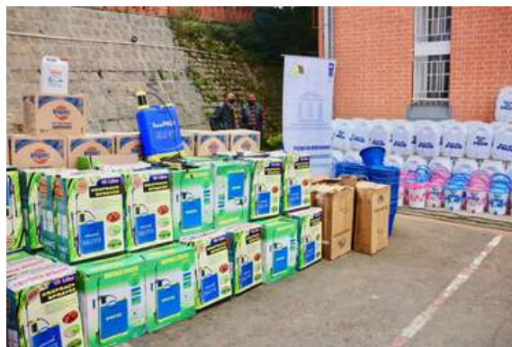
La dotation remise au Ministère de la Justice comprend notamment divers lots de masques, de produits désinfectant pour sol, de liquide détergent, de gels désinfectant pour mains, de gants en latex, de pulvérisateurs, une centaine de distributeurs d'eau et une centaine de seaux d'eaux.

A Madagascar, la réponse du PNUD face à la pandémie de covid-19 s'articule autour de trois objectifs : aider le pays à se préparer et à protéger les populations contre la pandémie et ses impacts, à réagir lors de l'épidémie, et à se remettre des impacts économiques et sociaux dans les mois à venir.