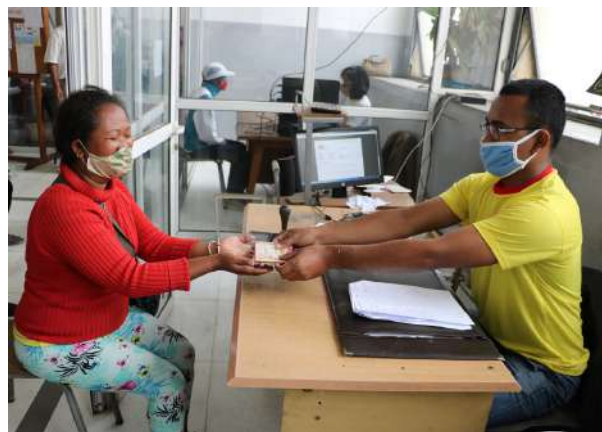
Le tosika fameno offre une bouffée d'oxygène aux familles vulnérables