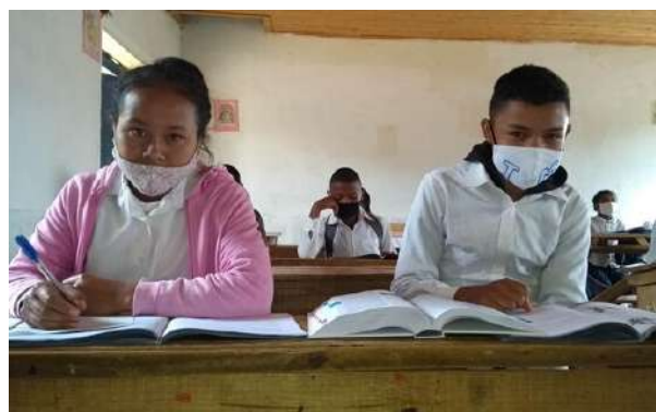
Les élèves dans le CEG d'Ambanitsena utilisant le livret scolaire

L'appui apporté par l'UNICEF vise à renforcer l'utilisation de multiples canaux pour la livraison de l'apprentissage à distance pour soutenir l'apprentissage des enfants les plus vulnérables qui n'ont pas accès aux ressources numériques ou médiatiques. UNICEF appuie aussi le renforcement du soutien aux enseignants, aux parents et aux soignants qui facilitent l'enseignement à distance et aide les écoles à protéger les enfants et leur communauté en leur fournissant les matériels d'assainissement des écoles et des informations vitales sur le lavage des mains et autres règles d'hygiène.